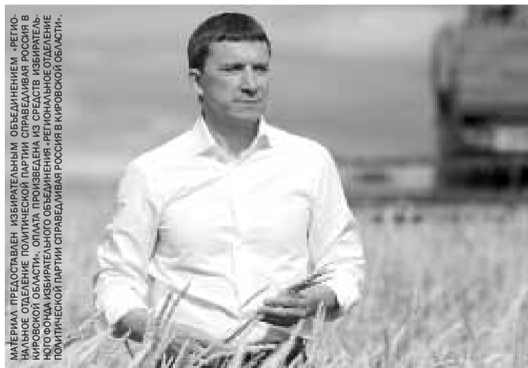
МАТЕРИАЛ ПРЕДОСТАВЛЕН ИЗБИРАТЕЛЬНЫМ ОБЪЕДИНЕНИЕМ «РЕГИОНАЛЬНОЕ ОТДЕЛЕНИЕ ПОЛИТИЧЕСКОЙ ПАРТИИ СПРАВЕДЛИВАЯ РОССИЯ В КИРОВОСКОЙ ОБЛАСТИ». ОПЛАТА ПРОИЗВЕДЕНА ИЗ СРЕДСТВ ИЗБИРАТЕЛЬНОГО ФОНДА ИЗБИРАТЕЛЬНОГО ОБЪЕДИНЕНИЯ «РЕГИОНАЛЬНОЕ ОТДЕЛЕНИЕ ПОЛИТИЧЕСКОЙ ПАРТИИ СПРАВЕДЛИВАЯ РОССИЯ В КИРОВОСКОЙ ОБЛАСТИ».

Или настала пора голо- совать за других – тех, кто, как СПРАВЕДЛИВАЯ РОССИЯ, действительно отстаивал все эти годы поддержку реального отечественного производства? Выбор – за всеми нами.