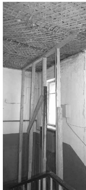
Удержатъ бы потолок в подъезде!

На помощь решила прийти управляющая компания: взяла кредит на «ремонтную» сумму, а затем его погасить (вместе, естественно, с банковским процентом) за счет собственников – кредитные расходы ввести в квартирные платежи. «Но с этим