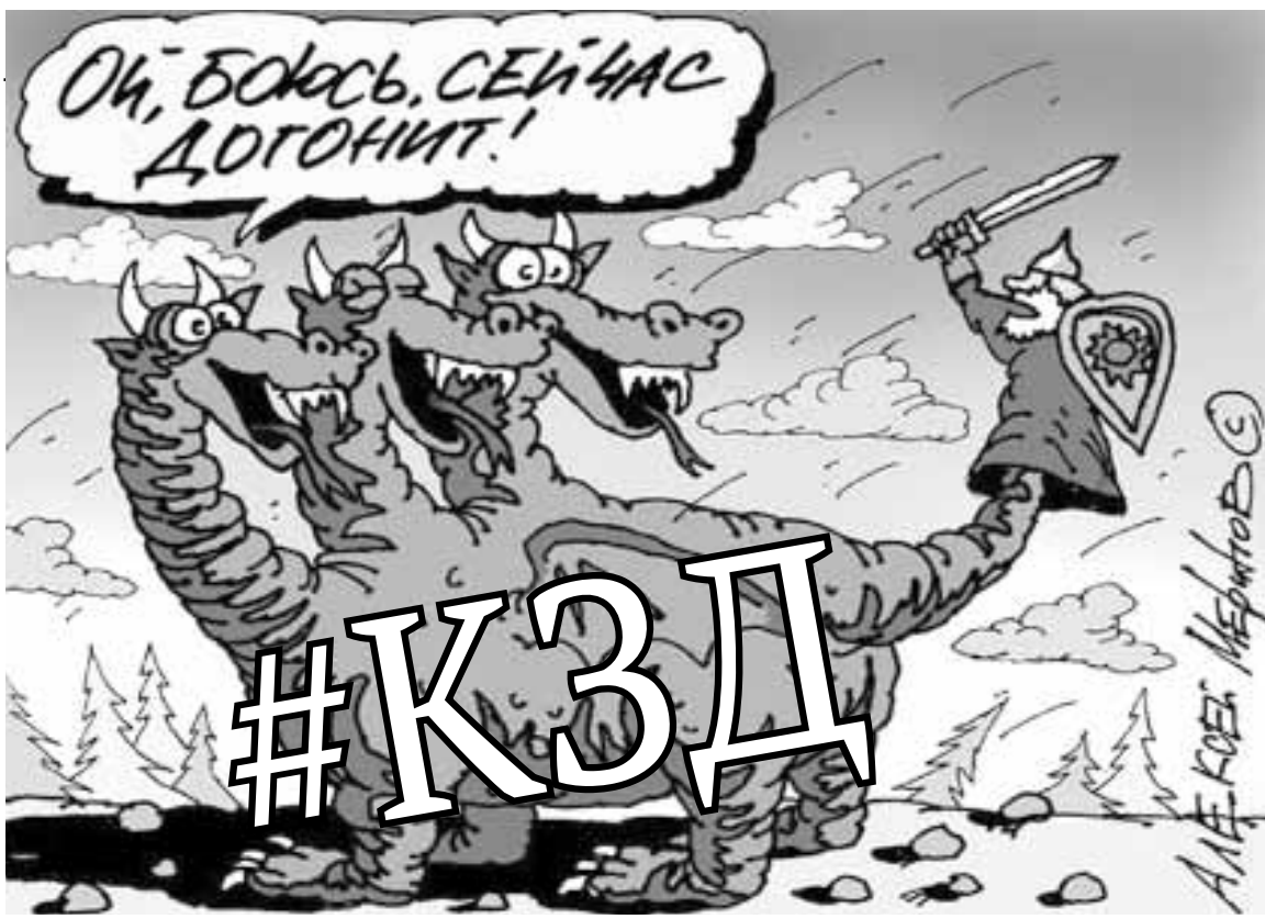
Рисунок А.Мерина («Московский комсомолец»)

действиях неустановленного лица признаков преступления — кражи, совершенной с незаконным проникновением в помещение, и оснований для возбуждения уголовного дела. Однако участковый решил не портить показатели на обслуживаемой им территории, для чего на основании сфальсифицированного им объяснения потерпевшего внес заведомо ложные сведения в постановление об отказе в возбуждении уголовного дела.