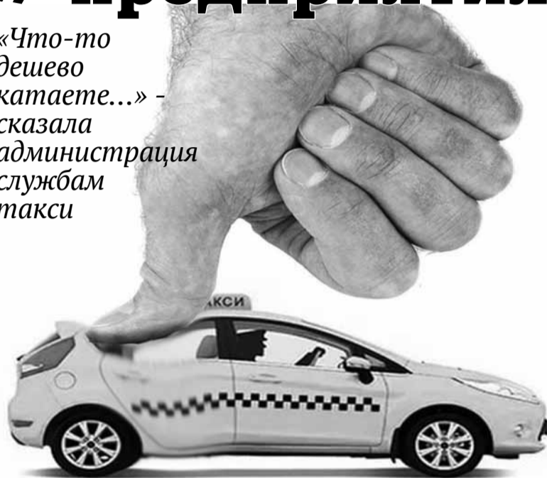
Стоимость одной поездки в общественном транспорте Кирово-Чепецка – 20 рублей. Поездка в такси – от 60 рублей.

«Что-то дешево катаете...» - сказала администрация службам такси